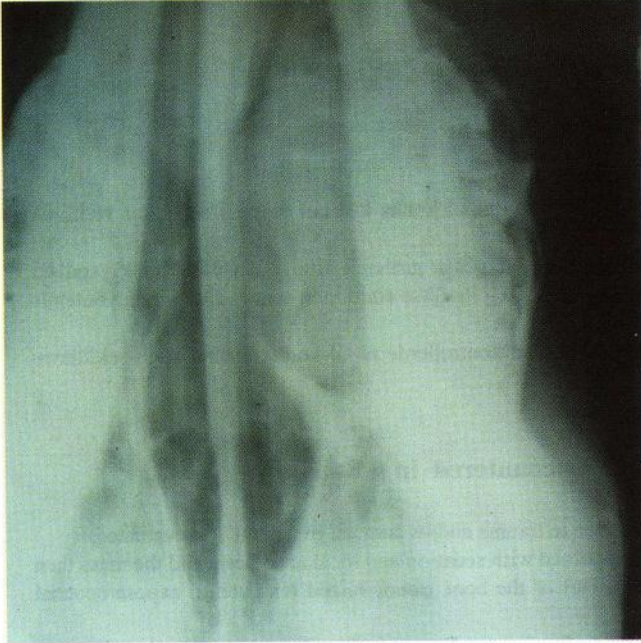
Şekil 1. Operasyon öncesi kistin radyolojik görünümü (V/D). Figure 1. Radiographic appearance of nasal cyst prior to operation (V/D).

nazal konha düzeyinde deformasyona yol açan kitlenin lokalizasyonu ve sınırları tespit edildi. (Şekil-1)