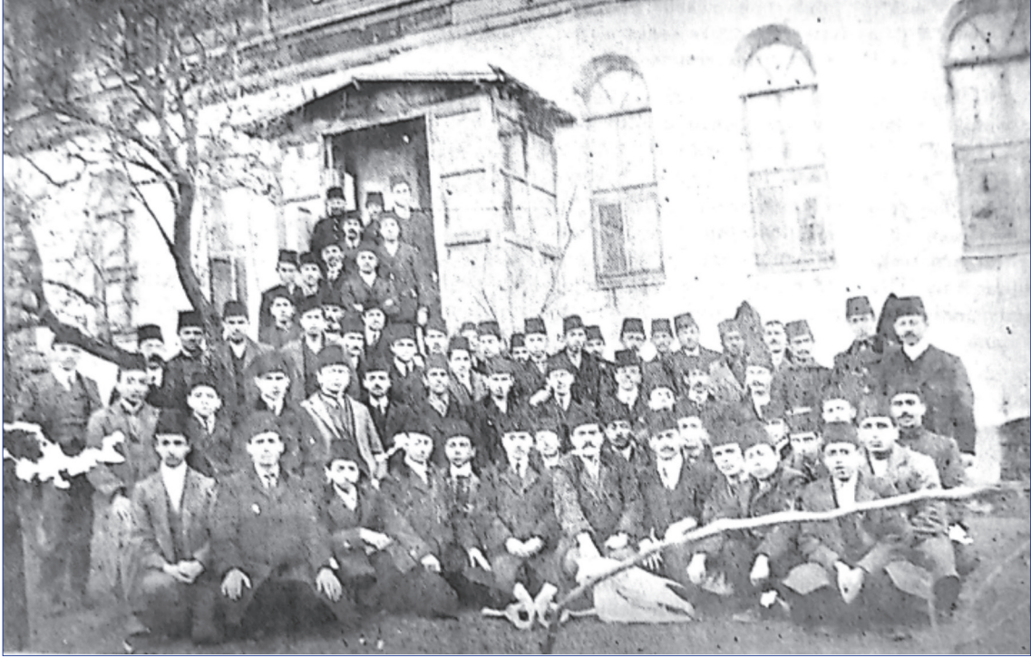
Şekil 1. Tatbikat-ı Baytariyye Mektebi öğrencileri öğretmenleri ile [14]

Umur-ı Baytariyye Müdüriyeti tarafından hazırlanan ödenek talebi onaylanarak 1910-1911 mali yılı genel bütçesine dâhil edilir. Okul, Ziraat Nezareti'nin bütçe taslağına kıyasla birkaç küçük değişiklik yapılarak 1470 liralık (147 bin kuruş) bir masrafla 14 Ekim 1910'da İstanbul'da Ahırkapı mevkiinde açılmıştır. Bu tarihteki resmi adı " Mülkiye-i Baytariyye Muavinlerine Mahsus Mekteb "; yani Muavin Baytar Mektebi'dir [12,14] . 5 Kaynaklar, bir sonraki mali yıl için okul ödeneğinin 2700 liraya yükseltildiğini (270 bin kuruş) göstermektedir [13,18] .