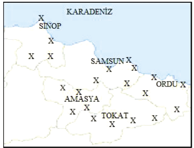
Şekil 1. Serolojik tarama için örnekleme yapıldığı yerler Fig 1. Locations of flocks and herds sampled for serosurvey