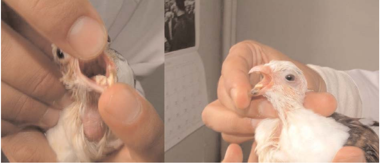
Şekil 1. Trikomoniazis'e bağlı olarak gelişen makroskopik lezyonlar

12. Lüthgen W, Bernau U: Metronidazol for the control of trichomoniasis of pigeons. Dtsch Tierarztl Wochenschr , 74 (12): 301-315, 1967.