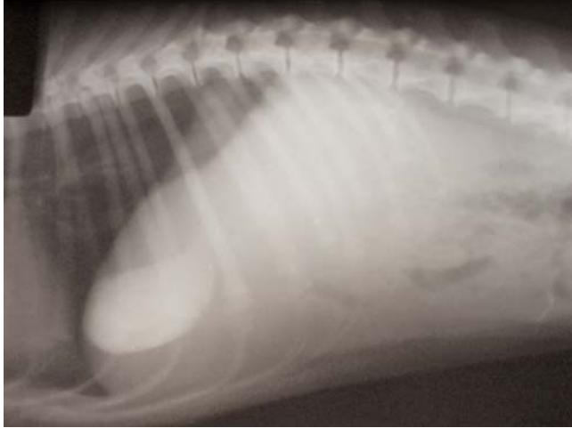
Şekil 1: Yumurta ve süt karışımı içirildikten sonra 3. saatte köpeğin latero-lateral kolesitogramı

kullanılarak yapılan virolojik incelemede hayvanın distemper olduğu doğrulandı. Tedaviye rağmen hayvanın klinik durumunun safra taşının operasyonla uzaklaştırılmasına uygun hale gelmemesi ve distempere bağlı sinirsel belirtilerin artması nedeniyle sahibi ile yapılan değerlendirme sonucu hasta ötenazi edildi.