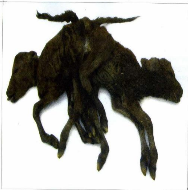
Şekil 1. Sysomien buzağının makroskopik görüntüsü. Figure 1. Macroscopic view of the sysomien calf.

Yerli melez ırka (3 yaşlı) ait olan ve doğumu normal olarak gerçekleşmediğinden sezaryen operasyonu ile alınan sysomien buzağılar Dicle Üniversitesi Veteriner Fakültesi Doğum ve Jinekoloji Kliniği'ne getirildi. Sysomien buzağılar, anatomik, patolojik ve radyografik olarak değerlendiril-