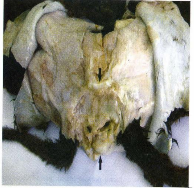
Şekil 2. Sysomien buzağının Tuber ischiadicum seviyesindeki kaynaşması (oklar).

Makroskopik yönden incelenen sysomien buzağının pelvis bölgesinde tuber ischiadicum sevi-