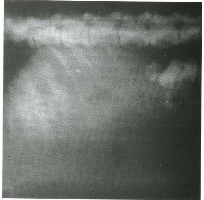
Şekil 4. Perkutan olarak safra kesesine enjekte edilen kontrast maddenin kolona ulaşması.

Figure 2. Percutaneous cholecystogram (case no 2, gall bladder is seen as a radioopaque oval area surrounded with arrows).