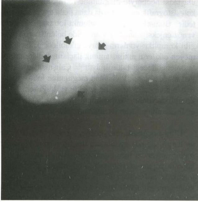
Şekil 2. Perkutan kolesistogram (olgu no: 2, oklarla sınırlandırılan alanda radyopak olarak safra kesesi görülmektedir).

İlk radyografik işlemi takiben, olgulara yemek yedirilmesinden sonra alınan radyogramlarda 5. dakikada, kont-