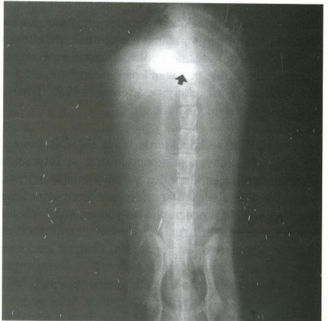
Şekil 5. Perkutan kolesistogram (60. dakika, olgu no: 8, kontrast maddenin safra kanalından ilerlemediği görülmektedir).

Figure 3. Percutaneous cholecystogram (case no 5, gall after feeding transmission of contrasting agent to ductus choledocus).