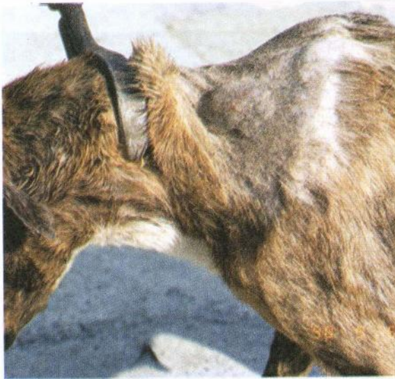
Resim 4. Kontrol grubu bir hayvanda regresyon öncesi tümörün görünümü Figure 4. The appearance of tumor prior to its regression in an animal from the control group.