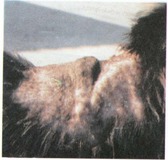
Resim 1. Kontrol grubu bir hayvanda oluşmuş tümör Figure 1. A formed tumor in an animal from the control group.