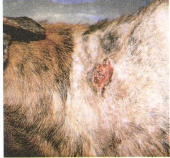
Resim 5. Aynı hayvanda regresyona uğramış ve ülserleşmiş olan tümör Figure 5. A regressed and ulcerated tumor in the same animal. (as Figure 4)