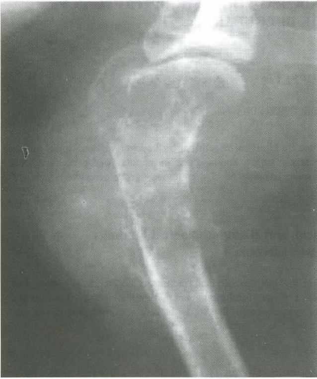
Şekil 1. Lezyonun M/L radyografik görünümü Figure 1. M/L radiographic view of the lesion.