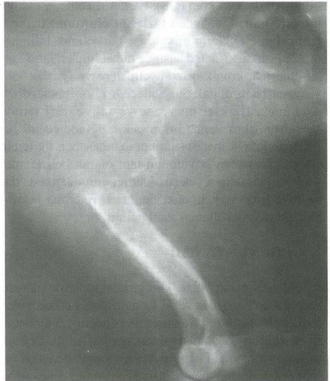
Şekil 3. M/L radyografide patolojik kırığın görünümü. Figure 3. M/L radiographic view of pathological fracture.

cunda yumuşak dokuya infiltrate, iğsi-oval hücreler ve geniş nekroz alanlarını içeren malign mezenkimal bir tümör olduğu, ancak spesifik bulgulara rastlanmadığı bildirildi. Bu bulgular ışığında biyopsiden 20 gün son-