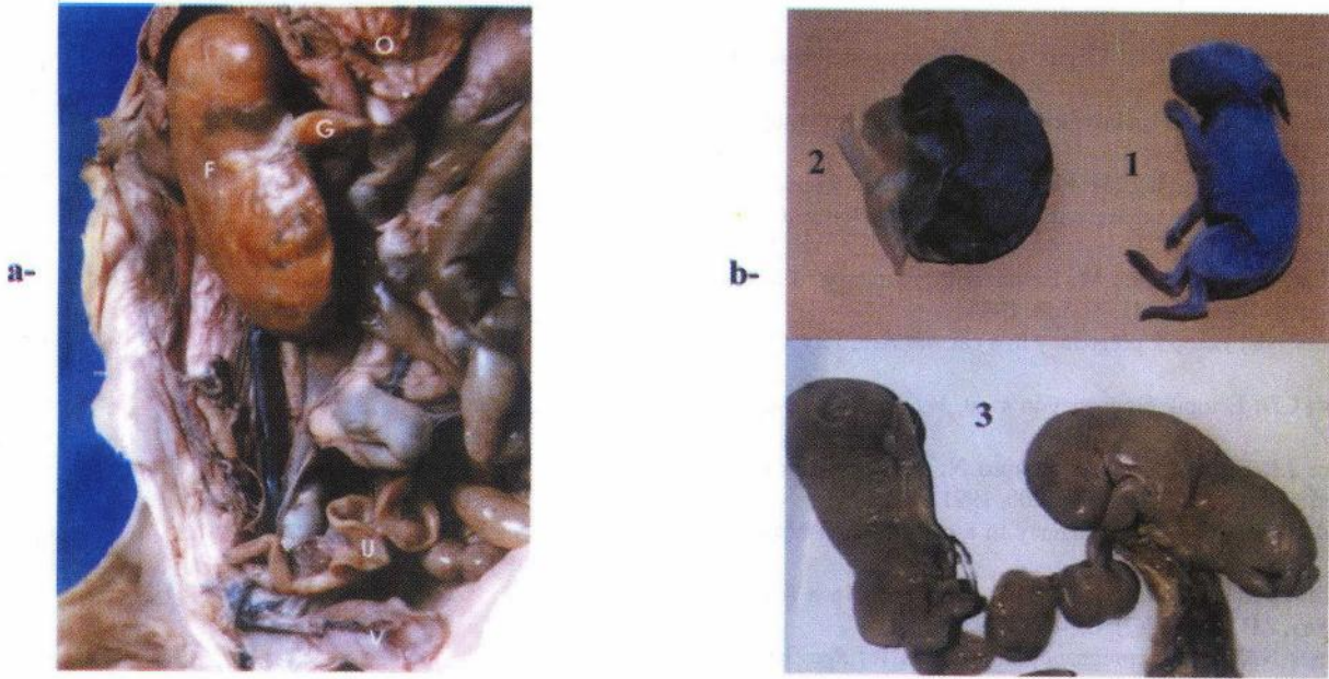
Şekil 2. a- 1. olgu; O: omentum, G: göbek kordonu, F: fetus, U: uterus, V: vesica urinaria, H: hepar, M: mamma b- Fetus, 1- yeni doğmuş bir yavru, 2- birinci olgunun fetusu, 3- ikinci olguya ait yavrular. Figure 2. a- 1. case; O: omentum, G: umbilicus, F: fetus, U: Uterus, V: Vesica urinaria, H: hepar, M: mamma b- Fetus, 1- new born child, 2- fetus of first case, 3- fetus of second case.

lenmesinden ve bir günlük bir tavşanla yapılan makro karşılaştırmadan gelişiminin tamamlandığı anlaşılmaktadır.