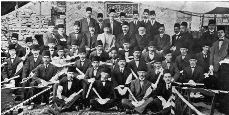
Şekil 1. " Baytar Ameliyat Mektebi "nin 1913 yılı yönetim ve öğretim kadrosu ile mezunları 18

Veteriner hekimliği öğretiminin özellikle Osmanlı dönemindeki gelişimine ilişkin çeşitli eserler 1,2,8,9 yayımlanmıştır. Ancak gerek ilk elden kaynakların yetersizliği gerekse mezuniyet belgelerinin Osmanlı Türkçesi ile yazılmasından ortaya çıkan zorluklar nedeniyle bu belgeler özelinde herhangi bir çalışma bulunamadı. Araştırma, bu eksikliği gidermek üzere Osmanlı Devletinde kurulan Askeri ve Sivil Veteriner Okullarından mezun veteriner hekimlere verilen mezuniyet belgelerinin incelenerek, bu belgelerden örnekler sunmak amacıyla gerçekleştirildi.