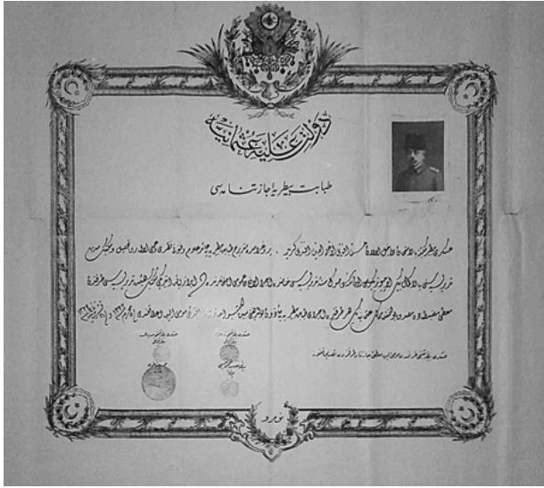
Şekil 5. Emin Efendi'nin "icâzet-nâme"si