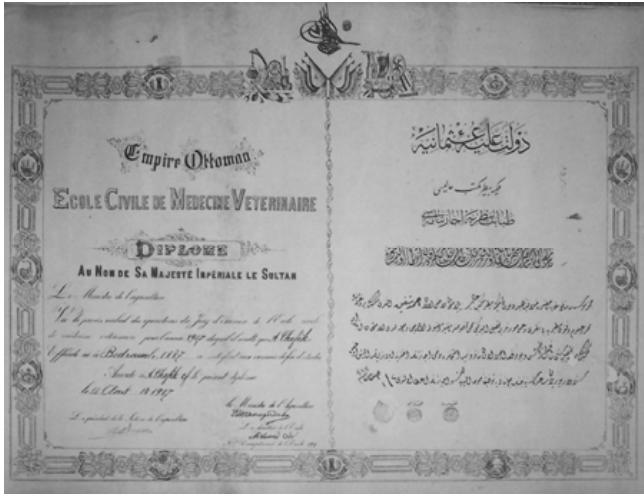
Şekil 3. Ahmet Şefik Efendi'nin "icâzet-nâme'si