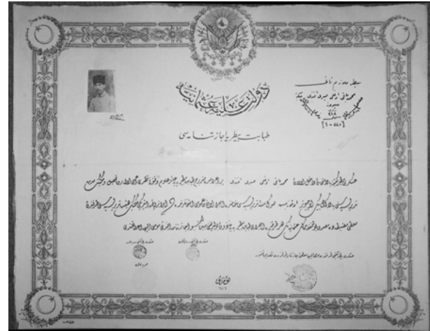
Şekil 7. Sabri Efendi'nin "icâzet-nâme'si Fig 7. The "icâzet-nâme" of Sabri Efendi

Mektepten Hurucu: Fi 29 Haziran sene 1335 (29 Haziran 1919)