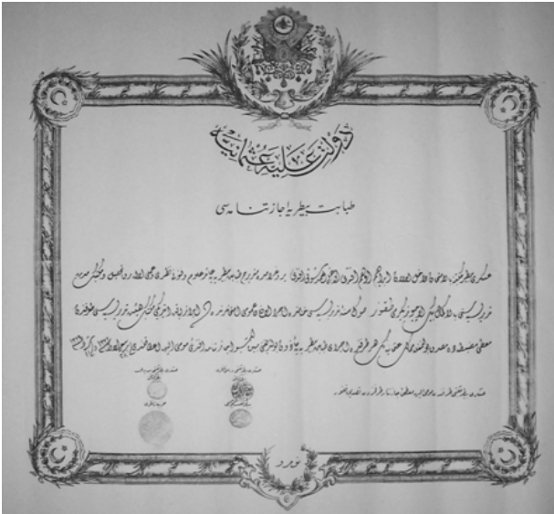
Şekil 6. Ahmet Şevki Efendi'nin "icâzet-nâme'si Fig 6. The "icâzet-nâme" of Ahmet Şevki Efendi

Harbiye Nazırı (Umur-ı Harbiye Nazırı) Yüce Osmanlı Devleti Baytarlık Mezuniyet Belgesi