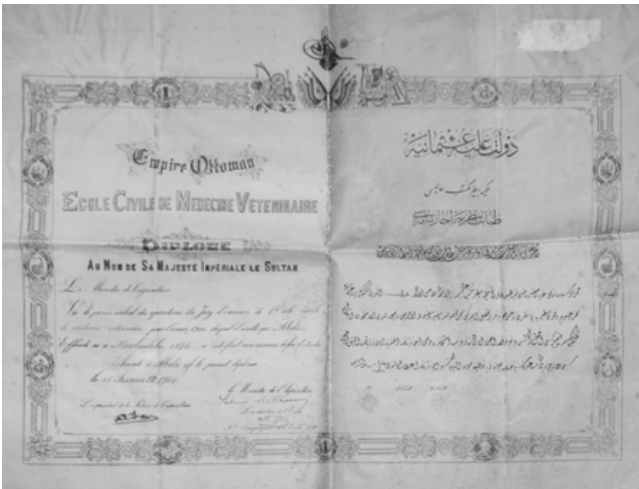
Şekil 2. Abdi Efendi'nin "icâzet-nâme"si